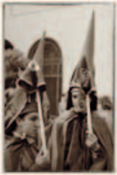
FOTO: El autor es José Salla, ganador de la salida a "Carnavales".