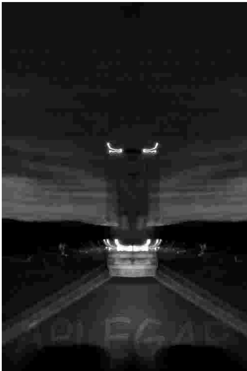
Imatge seleccionada al I Concurs nacional de fotografia de gran format a l'espai urbà

analógicos, tradicionales y para nada virtuales.