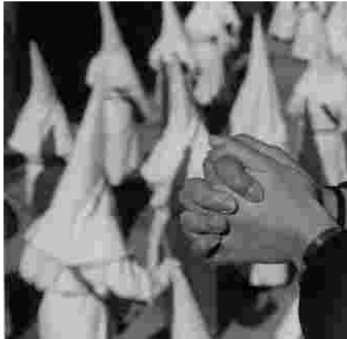
Segon premi Autor: Julián Barón