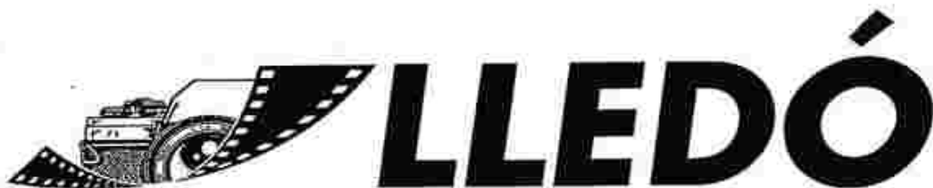
FOTO - VIDEO - IMAGEN DIGITAL

TODO EN FOTOGRAFIA I VIDEO-MATERIAL PROFESIONAL REVELAMOS SUS FOTOS Y DIAPOSITIVAS EN UNA HORA AMPLIACIONES FOTOGRAFICAS HASTA 30X45 EN UNA HORA