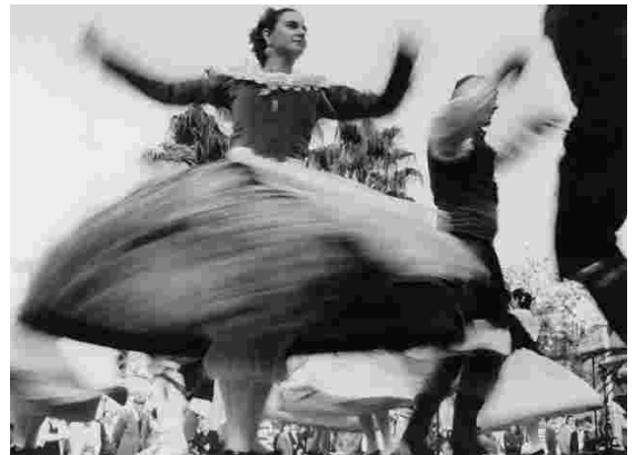
Tercer premi Autor: Ramón Claramonte