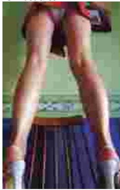
EDITA: Agrupació fotogràfica Sarthou Carreres C.I.F. G- 12094801