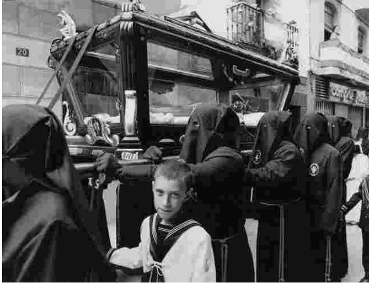
Primer premi Autor: Pepe Albert