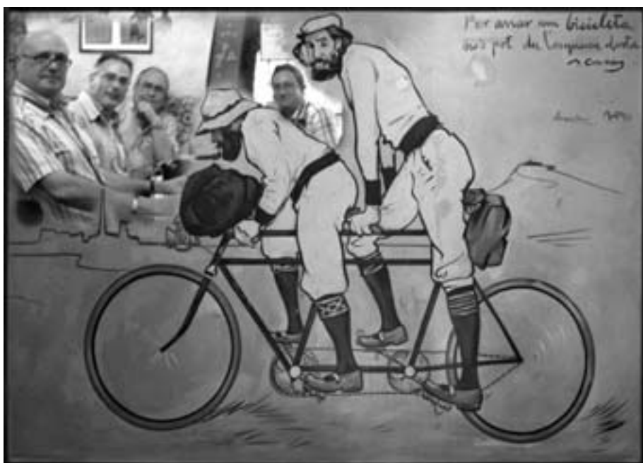
Miembros de la Agrupación almorzando en "Els quatre gats"

En resumen la edición mas deslucida de toda su historia donde todo lo que había que enseñar cabía en el pabellón número dos.