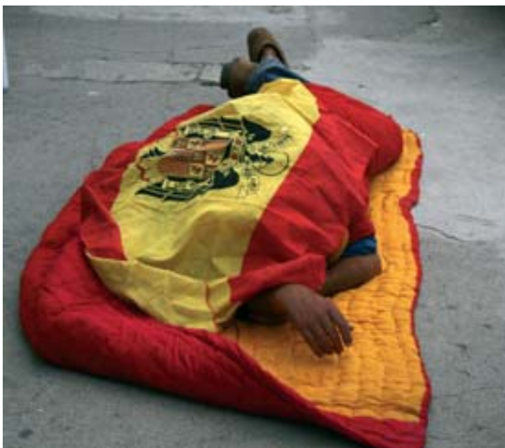
Tercer Premio Arcadio Vidal "Borrachera política"