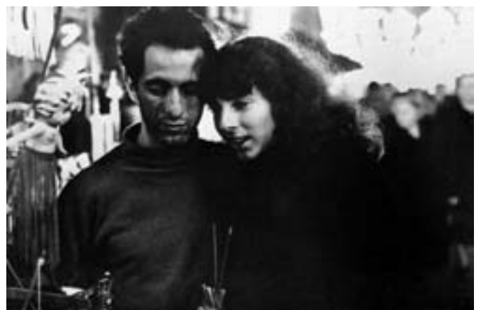
"The Family of The Man", 1955