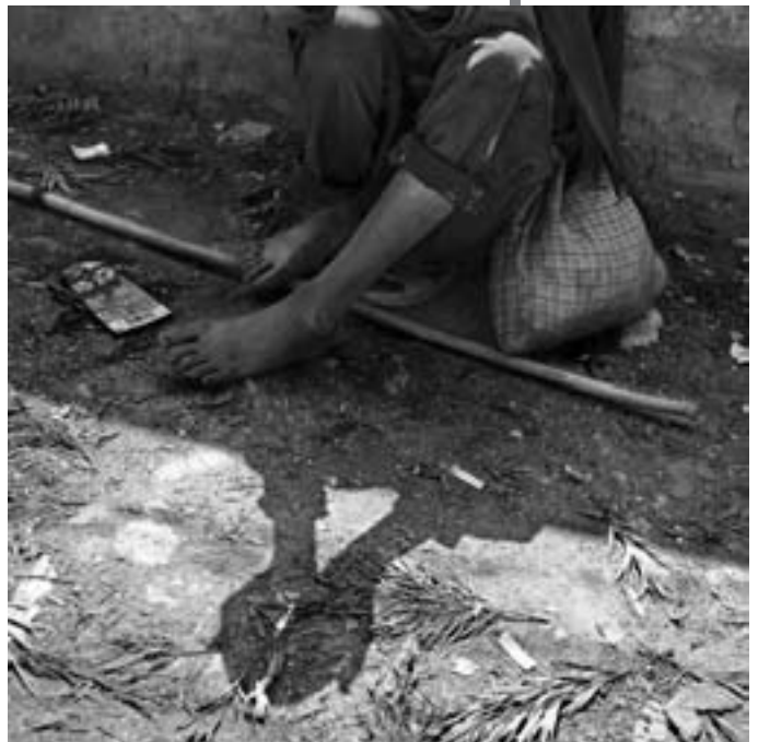
Segundo Premio Ximo Campos "Ayúdame"