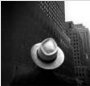
Foto: "El Rokefeller Center mirando desde el edificio de la RCA" Louis Fauer, 1947.