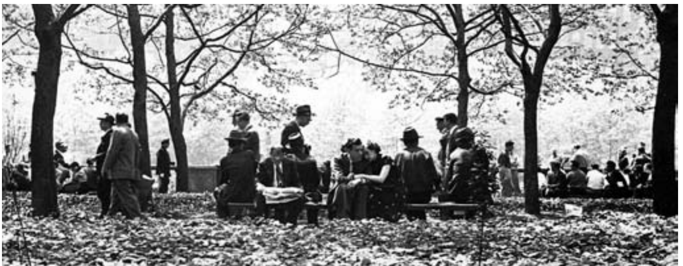
Obra de Robert Frank en la Exposición "The Family of The Man", 1955

Louis Faurer fue redescubierto gracias a una exposición organizada por la Universidad de Maryland en 1981. En el catálogo, el prestigioso crítico que lo prologaba afirmaba haber comprendido de repente que "...La fotografía americana de los años 50 pertenecía incontestablemente a Louis Faurer". El redescubrimiento de Faurer sigue en nuestros días.