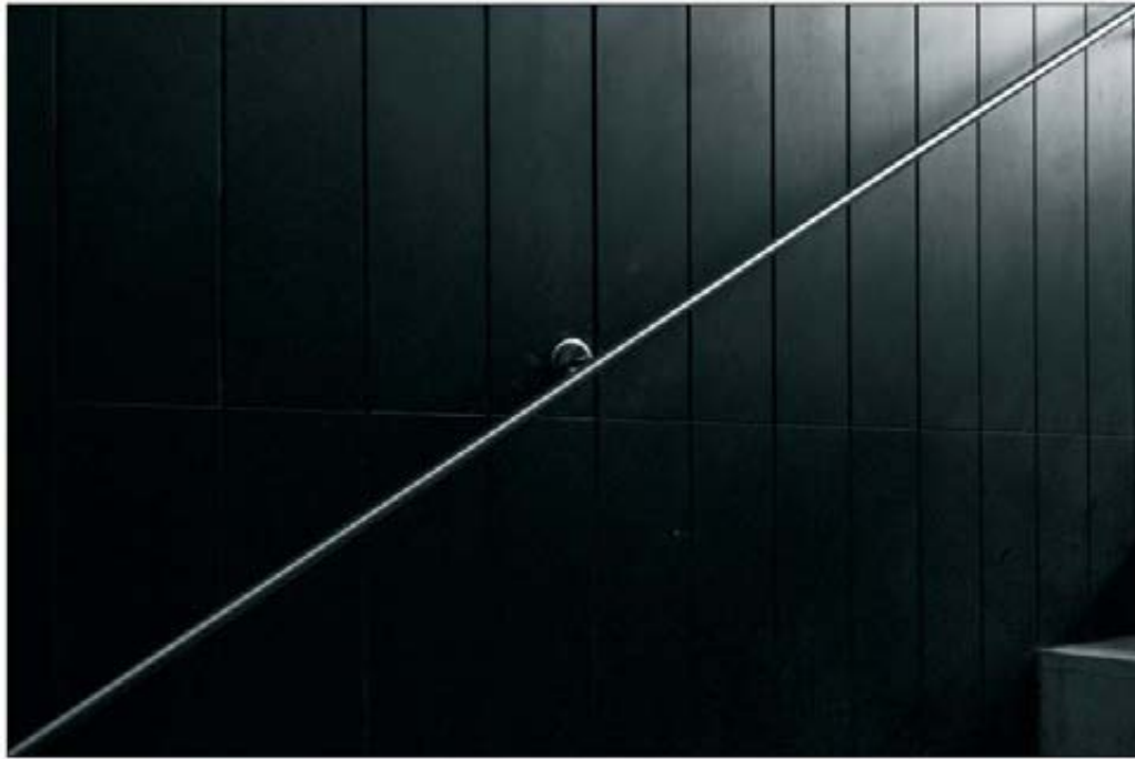
Primer Premio Carlos Amiguet "S/T"