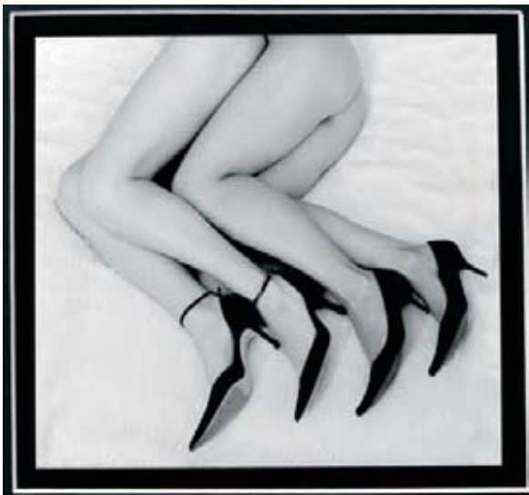
Segundo Premio Paco Senón "Abanico de charol"