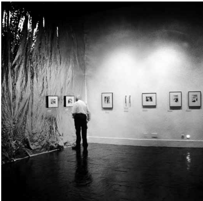
Photoespaña - Exposición Warhol