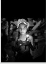
Devota de Babalú Ayé, en Ek Rincón (Cuba).