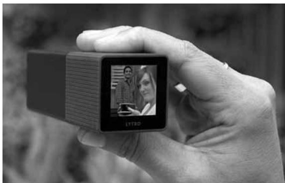
Lytro ¿Cámara o caleidoscopio?

Grande es el amor que nos profesan los fabricantes, no hacen más que pensar en nosotros, piensan y trabajan sin pausas para hacer más grata nuestra vida. A causa de ello y a partir de pronto, eso: ni en-fo-car. Tomarás tus fotos por aquí o por allá, con la mano o con el pie y... ya decidirás después. Hechas mano de archivo y hoy... enfoco a este, al mes que viene... enfoco a aquel; o enfocas al que te paga la copia, para que se fastidie el que no la compró. ¡La leche! Simplemente: ¡la leche! Y todo esto, claro, vol-