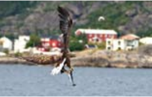
Verano en Círculo Polar Juan Maestro

10.00 Dr. Joaquim Baixeras: ¿Porqué investigar sobre insectos? El millón de especies que se conocen representan un reto para el conocimiento, pero el mayor desafío reside en las innumerables interacciones que tienen con el hombre y con la naturaleza.