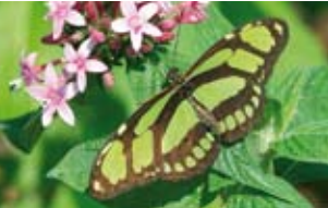
Insectos Joaquim Baixeras

10.00 Dr. Joaquim Baixeras: ¿Porqué investigar sobre insectos? El millón de especies que se conocen representan un reto para el conocimiento, pero el mayor desafío reside en las innumerables interacciones que tienen con el hombre y con la naturaleza.