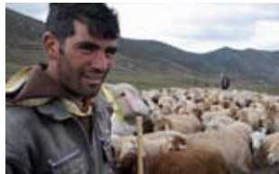
En bicicleta por Irán