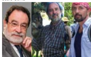
Un planeta sostenible R. Folch, Alejandro Olaya & F. Trujillo