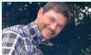
Una nueva especie