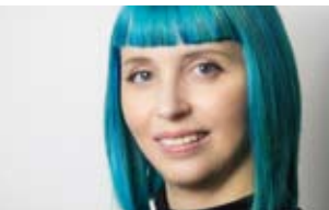
El paisaje Rosa Isabel Vázquez

11.00 Filmando lo salvaje. Los documentales de naturaleza son películas, no reportajes. Como tales deben incorporar una historia bien pautada, que debe ser creada con trozos de vida salvaje real. Tras participar como director y/o guionista en más de 120 documentales por todo el mundo, el biólogo Fernando López Mirones, que ha creado historias de animales para National Geographic, BBC Natural History Unit, Survival y Terra Mater entre otros, nos mostrará algunas de sus anécdotas y trucos de rodaje más llamativos, así como unas pautas a seguir para iniciarse en la realización de documentales de historia natural.