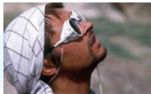
Montañas Ramón Portilla

- Safari en Sudáfrica , de Albert Masó (viajes Australphoto). Recorrido por el Kruger NP, una reserva con dos millones de hectáreas y una valla de 900 km. La buena gestión conservacionista y sus enormes manadas de grandes mamíferos lo convierten en un destino único para obtener fotografías de especies muy difíciles de ver en otros sitios.