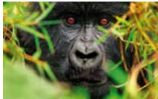
Un equilibrio frágil