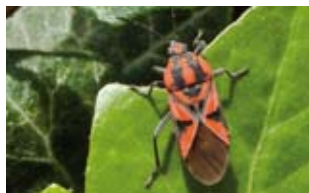
Un buen documento