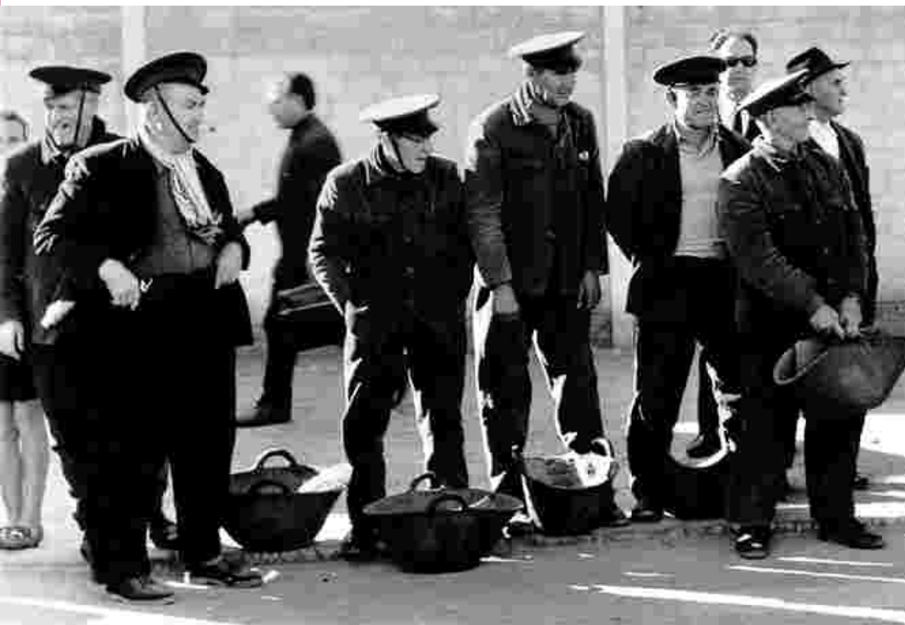
"Sin título", Castellón, 1955