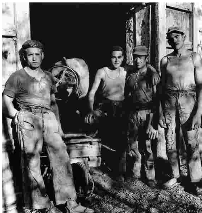
"Compañeros", Castellón, 1957