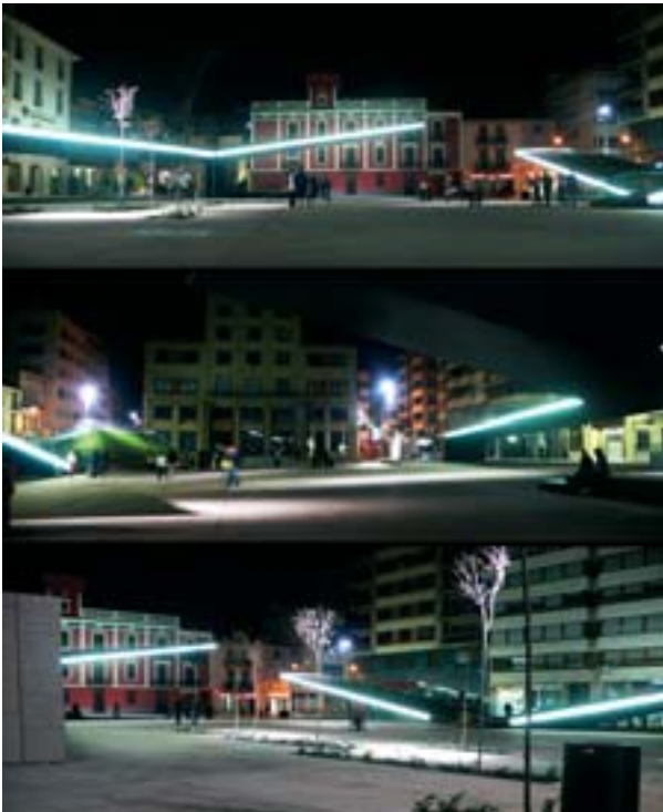
Segundo Premio Vicent Dosdà "Triptic-plaça"