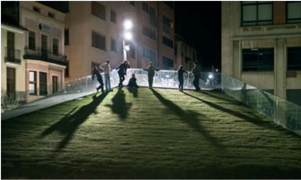
Primer Premio Joan Julbe "Llums i ombres"