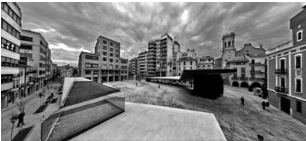
Tercer Premio Ricardo Badenes "Angular"