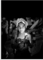
FOTO: Fotografía de Xavier Ferrer. Devota de Babalú Ayé, en Ek Rincón (Cuba).