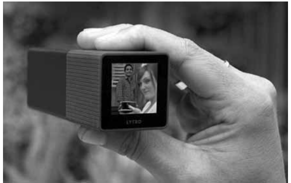
Lytro ¿Cámara o caleidoscopio?

Grande es el amor que nos profesan los fabricantes, no hacen más que pensar en nosotros, piensan y trabajan sin pausas para hacer más grata nuestra vida. A causa de ello y a partir de pronto, eso: ni en-fo-car. Tomarás tus fotos por aquí o por allá, con la mano o con el pie y... ya decidirás después. Hechas mano de archivo y hoy... enfoco a este, al mes que viene... enfoco a aquel; o enfocas al que te paga la copia, para que se fastidie el que no la compró. ¡La leche! Simplemente: ¡la leche! Y todo esto, claro, vol-