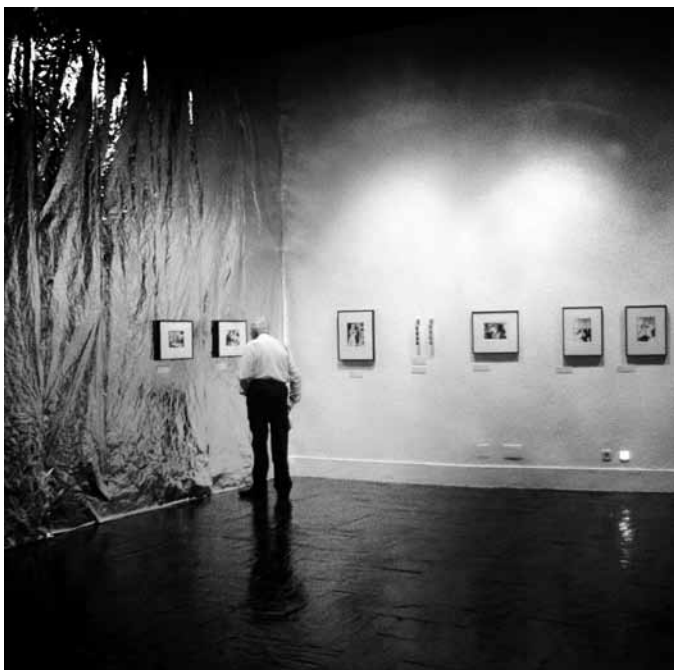
Photoespaña - Exposición Warhol