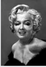
FOTO: El físico y fotógrafo Andrzej Dragan ha realizado un interesante experimento de manipulación fotográfica para un trabajo publicitario; utilizando un software y técnicas especiales, Dragan logra efectos sorprendentes y responde a una pregunta que se antoja necrófila, ¿como luciría Marilyn Monroe en el 2013?.