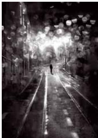
Tercer puesto: Inés Gil (FCLV)