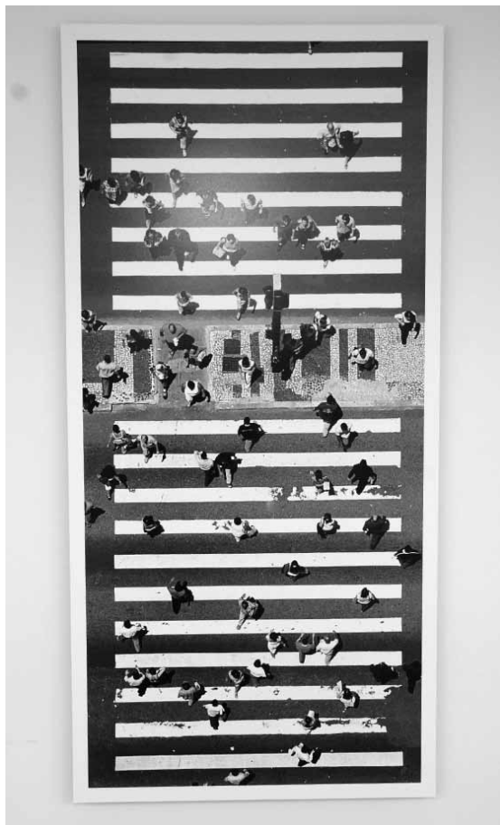
Fotografía de Tuca Vieira

La respuesta. Aunque en estos casos es al público local, no relacionado con la fotografía, a quien se preferiría tener de cara y complacer, las reacciones opuestas a cuanto acontecimiento novedoso pueda realizarse en una pequeña urbe como la nuestra no se suelen hacer esperar; bajo mi prisma, tengo que confesar que han sido bien pocas, el gesto despectivo ante lo que no “entendemos” o no nos gusta, se